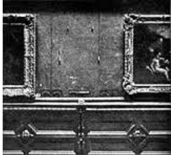
Vincenzo Peruggia 1881-1925

Un terrible accident a lieu en 1911. La Joconde étant exposée à ce moment là, au Louvre, dans la salle des plus grands chef-d'œuvres, elle est volée par un certain Vincenzo Peruggia le 21 août 1911 dans le but de la ramener dans son pays d'origine: l'Italie.