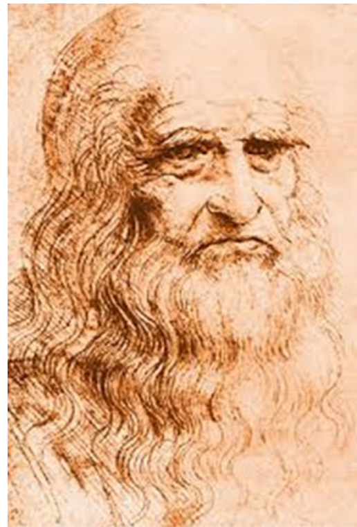
Léonard de Vinci (1452-1519)