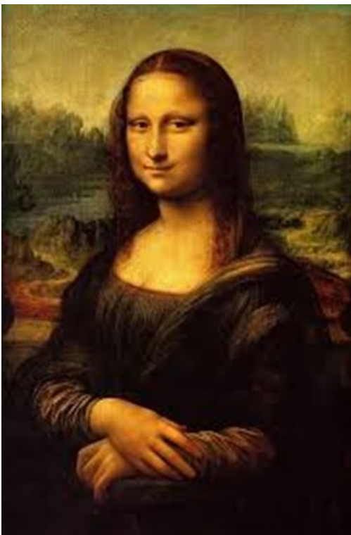
La Joconde (1503-1506)

L'art italien se caractérise en particulier par l'incontournable Léonard de Vinci. Notamment grâce à ses inventions et peintures, principalement sa magnifique et « mystérieuse » Joconde. Celle-ci est réputée dans le monde entier et plus particulièrement en Europe pour ses nombreux mystères.